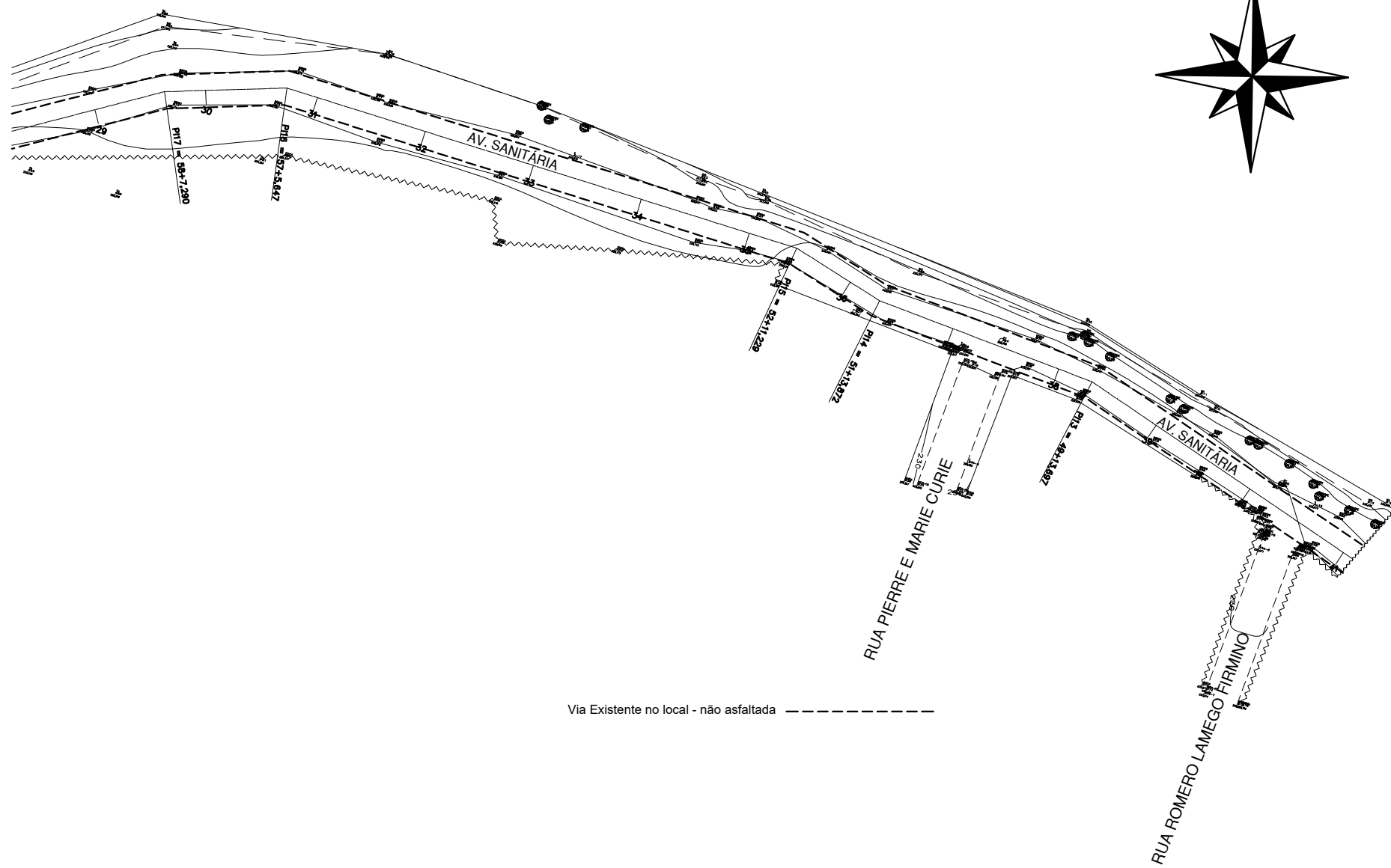
PLANTA TOPOGRAFIA ESTACA 29 a 62 ESCALA.:1/1000